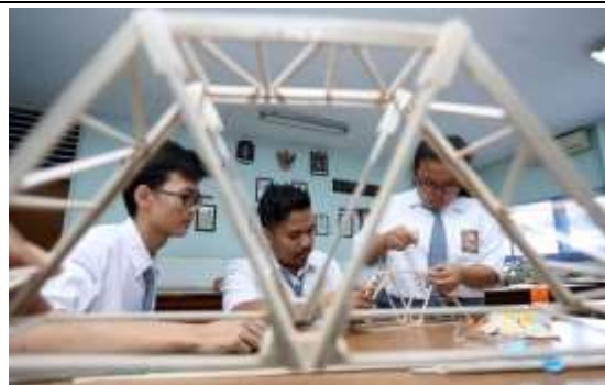
Gambar 3. Contoh Proyek Konstruksi Jembatan dalam Mata Pelajaran Fisika

Dengan melakukan pengukuran langsung, siswa belajar untuk memahami bagaimana konsep abstrak seperti geometri dan matematika digunakan dalam dunia nyata, baik dalam konstruksi maupun dalam berbagai profesi lainnya. Proyek ini juga membantu siswa untuk berpikir kritis tentang bagaimana mereka dapat mengoptimalkan sumber daya yang tersedia dan mengurangi kesalahan dalam perhitungan.