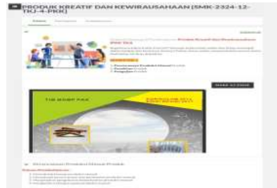
Gambar 5. Contoh penggunaan media pembelajaran konten digital pada filsafat esensialisme.

pelatihan mental, diskusi, presentasi tugas, dan transfer informasi.