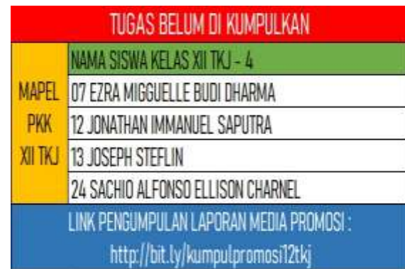
Gambar 3. Contoh daftar tugas belum dikumpulkan mata pelajaran PKK aliran filsafat idealisme.

Pendidik membantu peserta didik untuk mengembangkan kepribadiannya dan berbagai pandangan yang mendalam. Metode pada pengajaran pandangan jenis idealisme salah satunya berupa penyampaian dengan menggunakan uraian kalimat atau kata-kata sehingga materi yang telah diberikan ke peserta didik berupa verbal atau abstrak.