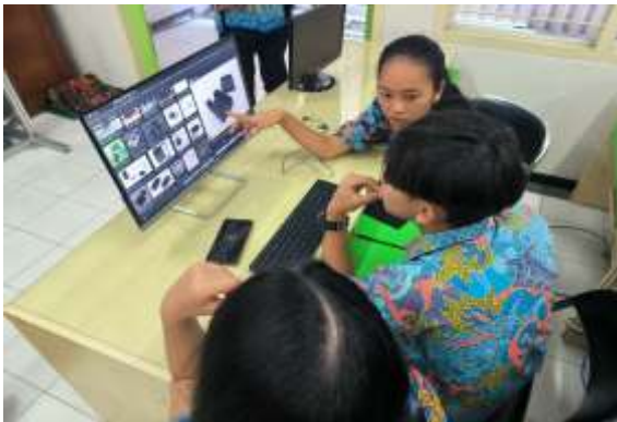
Gambar 4. Contoh penggunaan teknologi aliran filsafat eksistensialisme.

Metode belajar menggunakan dialog, serta teknik belajar pengalaman pemecahan masalah tanpa kekerasan. Metode yang tepat untuk membantu siswa dalam mengidentifikasi dan menjadi dirinya sendiri. Metode guru tidak menekankan transfer pengetahuan kognitif atau mendorong siswa untuk mengajukan berbagai pertanyaan.