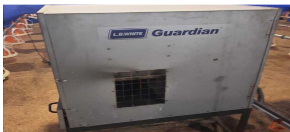
Gambar 3 pemanas heater

tersebut ditempatkan dengan jarak 2 meter satu sama lain. Pemanfaatan teknologi pemanas ini secara efisien mengatur suhu di dalam kandang, menciptakan lingkungan yang hangat dan mendukung kebutuhan termal hewan ternak. Dengan demikian, aspek-aspek ini diintegrasikan untuk memastikan kondisi kandang yang optimal bagi pertumbuhan dan kesejahteraan hewan ternak.