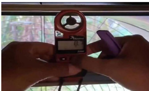
Gambar 7. Anometer

pemahaman bahwa kecepatan angin dapat bervariasi setiap saat, dipengaruhi oleh perbedaan tekanan udara di berbagai wilayah kandang. Implementasi teknologi ini tidak hanya menciptakan lingkungan yang nyaman untuk ayam tetapi juga memastikan efisiensi dalam manajemen suhu dan kualitas udara di Kandang Close House.