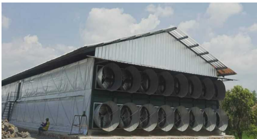
Gambar 6. bagian belakang kandang sebagai pembuangan udara kotor

Kecepatan angin diukur secara berkala dengan menggunakan anemometer pada berbagai lokasi kandang, seperti depan, tengah, dan belakang. Pengukuran ini memberikan pemahaman yang detail tentang seberapa baik sistem ventilasi bekerja dalam mempertahankan kondisi udara yang optimal untuk ayam. Pentingnya pemantauan ini diperkuat oleh