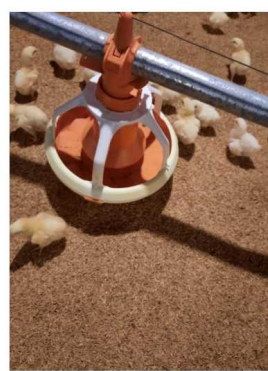
Gambar 5. mesin pakan otomatis