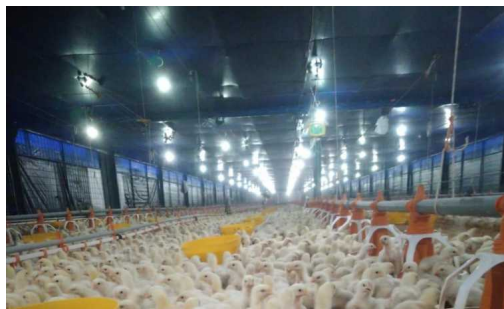
Gambar 8. lampu yang digunakan untuk kandang

konvensional pada ayam pedaging adalah dengan memberikan cahaya secara terus menerus. (Setianto, 2009). Intensitas dan lama pencahayaan merupakan faktor penting dalam produksi ayam pedaging. Program pencahayaan dapat mengontrol pertumbuhan, meningkatkan efisiensi pakan, meminimalkan mortalitas, mengurangi problem kaki, menurunkan ascites, mengurangi mati mendadak, meningkatkan kemampuan hidup dan menurunkan biaya listrik (Anonimus, 2008).