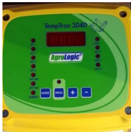
Gambar 4. Alat pengatur suhu kandang

ayam, mendukung kesehatan dan kesejahteraan mereka. Integrasi sensor yang terprogram dengan baik, pemantauan suhu dan kelembaban menjadi lebih efisien, memberikan lingkungan yang nyaman dan aman bagi ayam broiler selama periode tertentu sesuai dengan pola harian yang teramati.