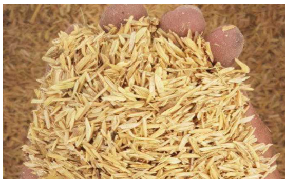
Gambar 2. sekam untuk alas kandang

juga menciptakan lingkungan yang mendukung pertumbuhan virus dan bakteri yang berpotensi merugikan kesehatan ayam. Salah satu ancaman utama yang muncul dalam kandang close house adalah tingginya konsentrasi amoniak ( \text{NH}_3 ), yang dapat memberikan dampak negatif terhadap kesejahteraan dan kesehatan ayam. (Seto, 2020).