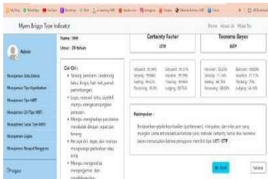
Gambar 9. Detail Riwayat Pengguna

Tampilan yang muncul ketika admin memilih button “Detail” pada halaman riwayat pengguna. Admin dapat melihat lebih rinci tentang hasil dari pengguna yang telah selesai melakukan tes. Admin dapat melihat dan juga mencetak laporan hasil tes tersebut.