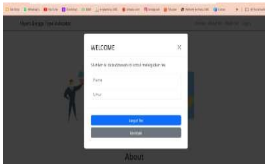
Gambar 3. Halaman Mulai Tes

Merupakan halaman mulai tes. Pada halaman ini, pengguna yang akan melakukan tes MBTI diharuskan untuk mengisi data dirinya (registrasi) terlebih dahulu sebelum melanjutkan tes.