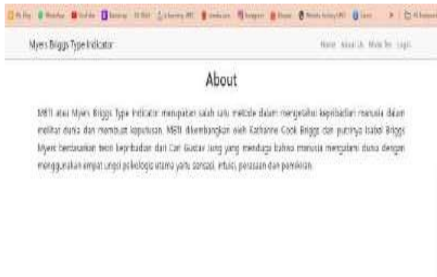
Gambar 2. Halaman About Us

Merupakan tampilan about us. Tampilan ini berisi penjelasan mengenai MBTI secara singkat.