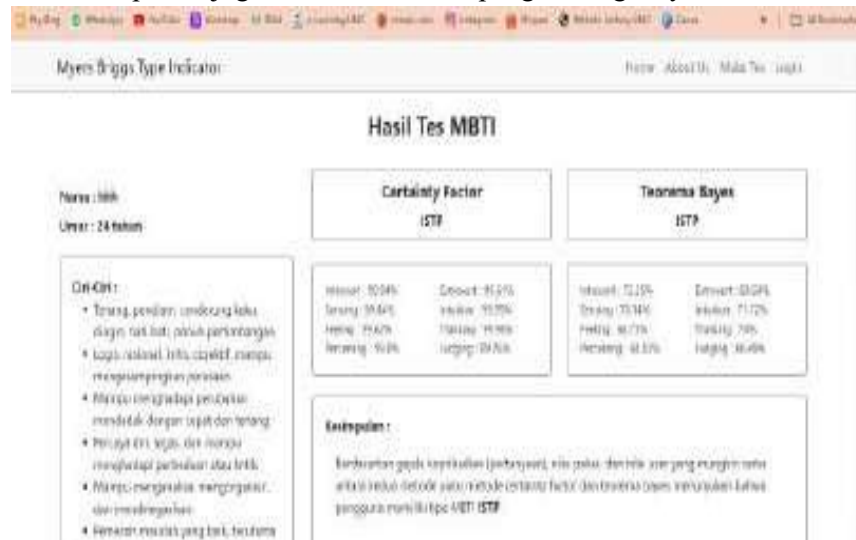
Gambar 4. Halaman Hasil Tes

Pada halaman hasil tes terdapat nama dan umur pengguna yang melakukan tes MBTI, kemudian terdapat hasil perhitungan certainty factor dan teorema bayes, dari kedua perhitungan metode ini didapatkan kesimpulan yang menjadi hasil tipe MBTI pengguna. Dari Hasil tipe MBTI tersebut akan ditampilkan juga ciri-ciri dan saranpengembangannya.