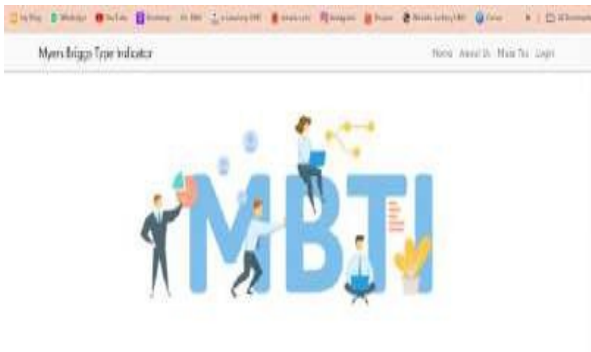
Gambar 1. Halaman Utama Sistem

Merupakan tampilan halaman utama pada Aplikasi Sistem Pakar Tes KepribadianMyers Briggs Type Indicator (MBTI) Dengan Menggunakan Perbandingan Metode Teorema Bayes Dan Certainty Factor.