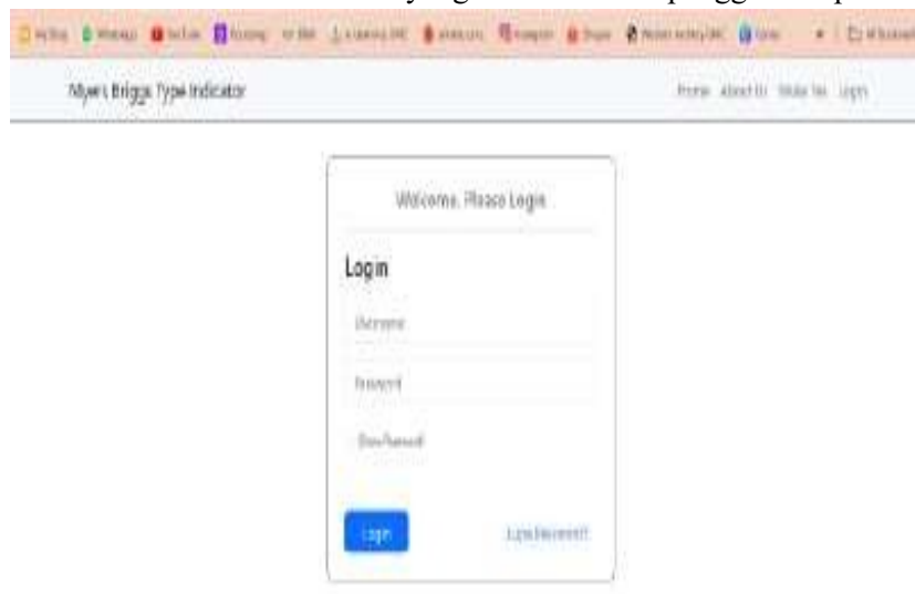
Gambar 5. Halaman Login

Merupakan tampilan halaman login. Admin harus mengisi username dan password untuk dapat mengakses sistem ini. Jika admin lupa password, admin dapat memilih button “Lupa Password” lalu akan diarahkan untuk mengisi e-mail yang terdaftar setelahnya admin dapat mengecek e-mail tersebut dan memilih link yang tersedia untuk penggantian password.