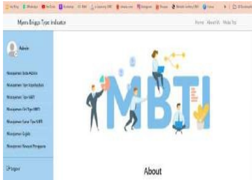
Gambar 6. Halaman Utama Admin

Merupakan tampilan yang muncul ketika admin sudah melakukan login. Admin dapat mengakses semua menu yang terdapat dalam sistem ini.